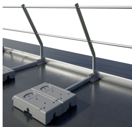
Mit Brüstung \leq 5 cm - min. 1 m Abstand von der Absturzkante