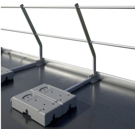
Ausführung 1 - mit Brüstung von 5 cm bis 10 cm